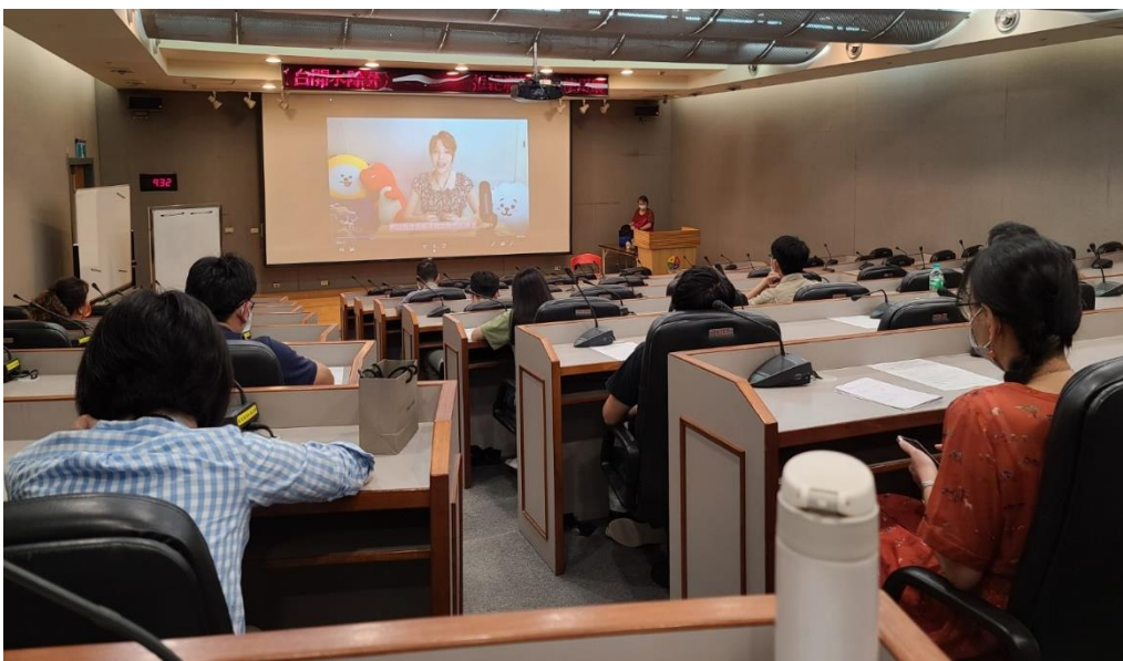
照片2-透過實際案例分享，使同仁理解性別歧視並重視多元性別權益